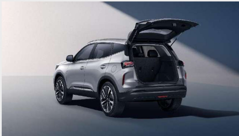
Objem zavazadlového prostoru: 430 l (se sklopenými sedadly: 1 190 l)