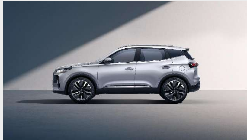
Celková délka: 4 320 mm, rozvor náprav: 2 610 mm