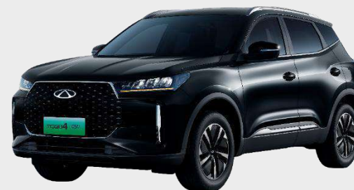
CARBON CRYSTAL BLACK (CL) Perleťový lak