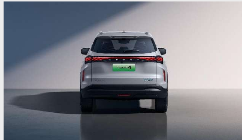
Celková šířka se zrcátky: 1 831 mm, celková výška: 1 652 mm