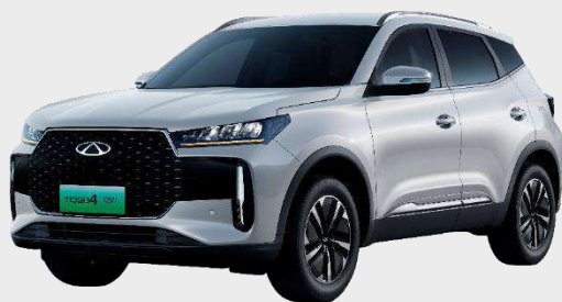
KHAKI WHITE (BW) Perleťový lak