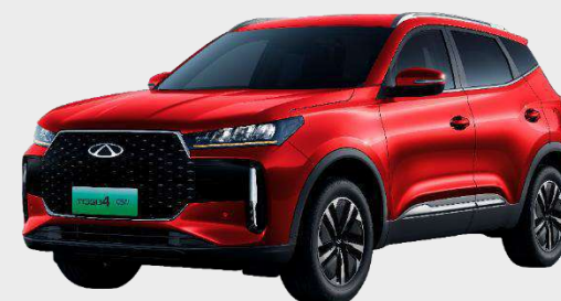
PRIME RED (NL) Metalický lak