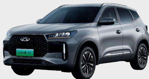
TECH GRAY (GX) Metalický lak